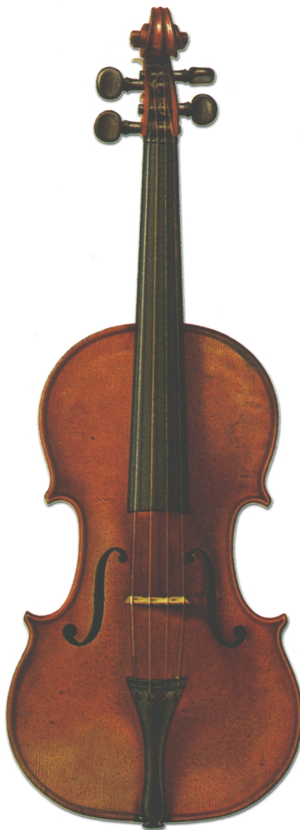
Antonio Stradivaris "Beth" daterad 1704.

Från latin kommer ordet mensur (mensura) som helt enkelt betyder mått. I musikaliskt språkbruk används ordet för att ange måttförhållanden eller proportioner.